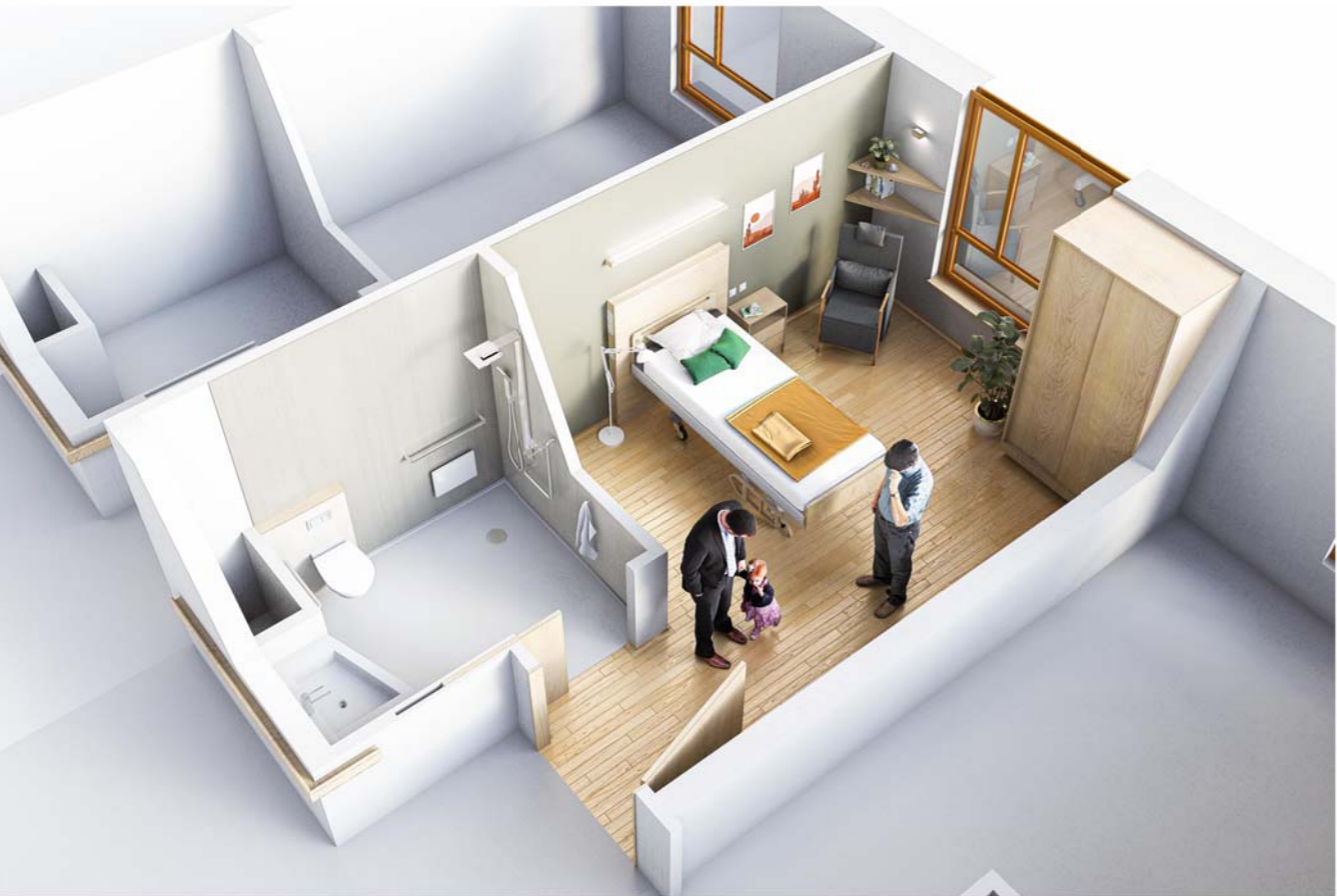
AXONOMETRIE CHAMBRE TYPE